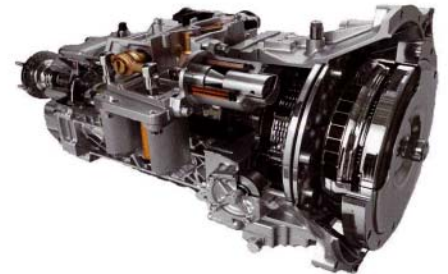
NEES 2 versnellingsbak